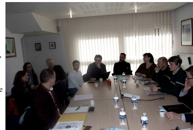
Réunion en mars en mairie de WAVILLE avec le sous-préfet et tous les services

Des réunions ont eu lieu notamment avec le Sous-Préfet et les services de l'État, du département, de la Région, etc. Le gros point d'achoppement de ce dossier, c'est bien sûr le financement, car pour l'heure, aucune réponse à nos demandes de subventions n'est parvenue en mairie. Nous vous tiendrons informés de ce dossier dans nos prochains bulletins.