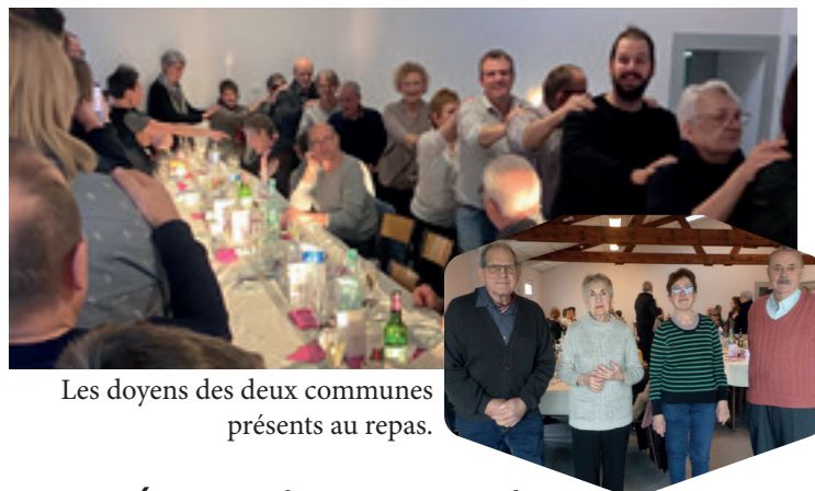
Les doyens des deux communes présents au repas.

Le traditionnel repas des anciens a cette année été organisé conjointement avec la commune de Villecey-sur-Mad. C'est près de 80 personnes qui ont profité de l'ambiance festive du repas offert par les deux communes à leurs aînés.